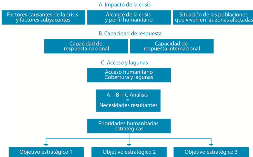
Figura 4. Esquema del Marco MIRA