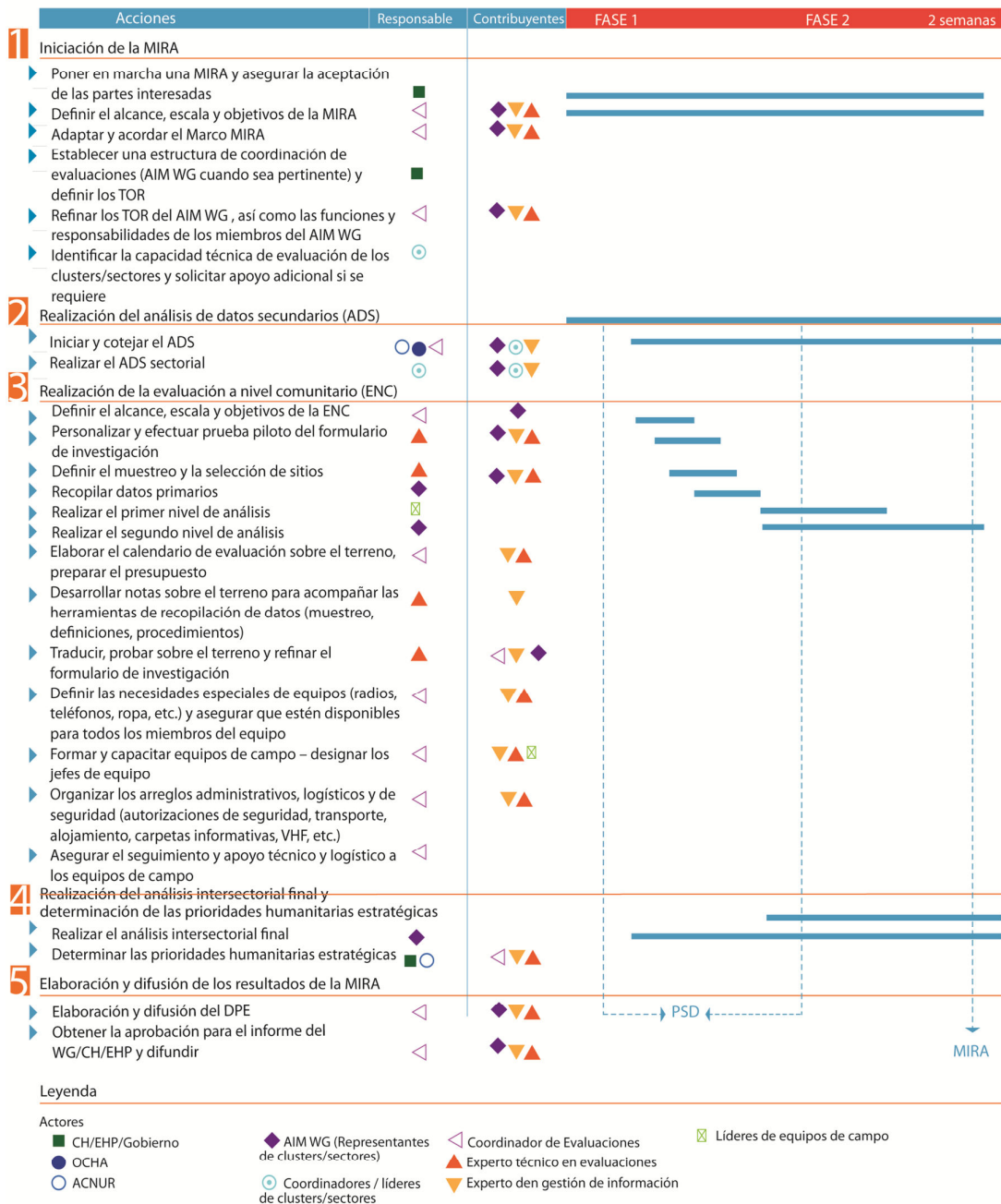
Figura 3. Funciones y responsabilidades propuestas de los diversos participantes en el proceso MIRA

Los pasos se desarrollan en mayor detalle en la Sección 3 sobre el enfoque MIRA .